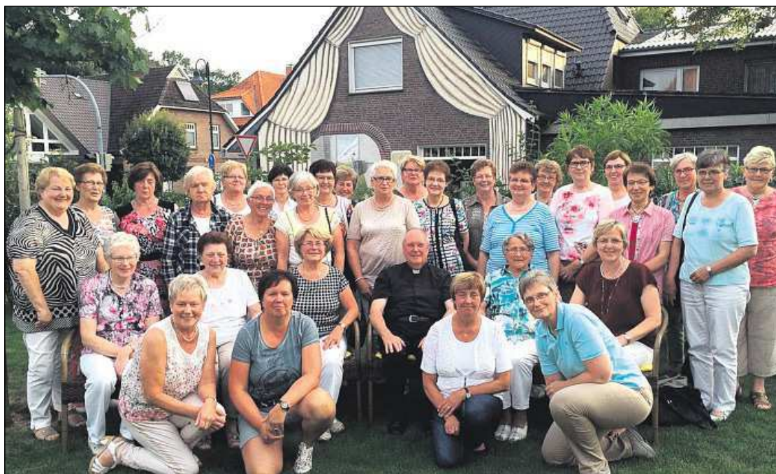
Verdienter Ausflug: Die Bezirkshelferinnen halten die Frauen-MC zusammen.

Zum Ehrentag gratulieren die Töchter nebst Familie, Verwandte, Nachbarn, Freunde und Bekannte. Sie wünschen dem Paar noch viele gemeinsame, gesunde und glückliche Jahre.